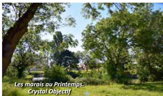
Les marais au Printemps. Crystal Objectif