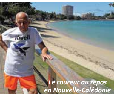
Le coureur au repos en Nouvelle-Calédonie