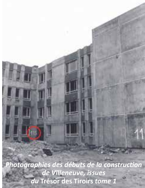
Photographies des débuts de la construction de Villeneuve, issues du Trésor des Tiroirs tome 1