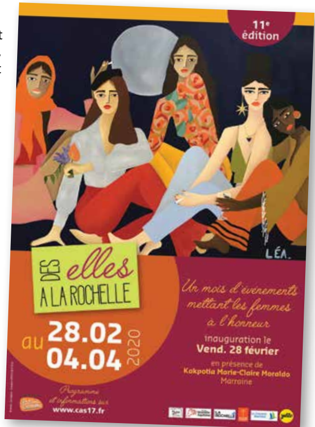
L'affiche du festival 2020 11 e édition

Héloïse Martin de Carabistouilles et Cie a donné la parole aux femmes, y compris à Villeneuve. Ces témoignages sont universels et se traduisent à travers des saynètes lors du spectacle « Mes Héroïnes » présenté au Carré Amelot le samedi 14 mars prochain ; puis deux temps d'échanges auront lieu l'un à Mireuil le 6 mars, l'autre à la médiathèque d'Aytré le jeudi 19 mars autour de « Fragments », une magnifique exposition-photos de femmes (vous pourrez la retrouver au Comptoir au mois d'avril). Avec l'association Contes Actes bien connue des Villeneuvois, vous pourrez écouter cinq conteuses raconter les femmes héroïnes à travers des récits de différents pays, le jeudi 19 mars à 18 h 30 au Comptoir. N'oublions pas une exposition sur les femmes spoliées ou oubliées du 16 au 29 mars organisée par le Centre d'information sur les droits des femmes et familles (CIDFF) à la médiathèque Michel Crépeau. Ne manquez pas les deux jours d'animations de rue concoctés par diverses associations les 7 et 8 mars place de Verdun, et venez même s'il pleut, un barnum est prévu !