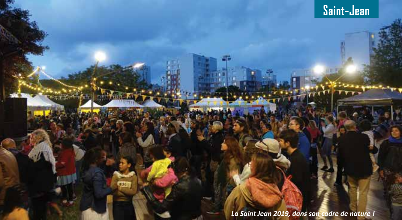
La Saint Jean 2019, dans son cadre de nature !