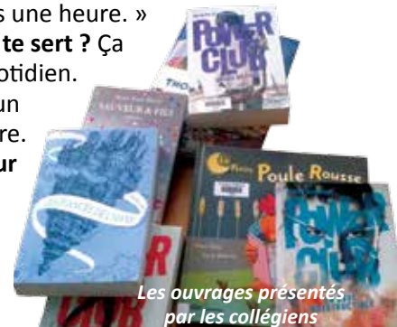
Les ouvrages présentés par les collégiens

Ne commence pas par des livres trop longs !