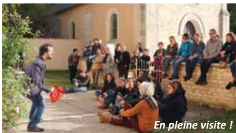
En pleine visite !

Avec la Cie Brasse-Bouillon, le quartier sera mis à l'honneur avec la création d'une visite insolite. Vous êtes-vous déjà demandé quelles célébrités avaient foulé le sol Villeneuvois ?