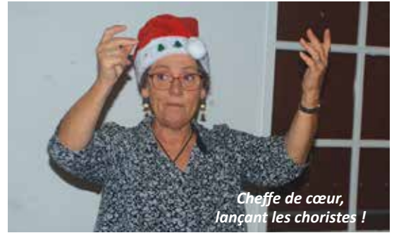
Cheffe de cœur, lançant les choristes !

dizaine de chansons, puis nous terminerons en chœur par deux chants communs. Chanter pour un public, ça nous bouscule parfois, ça nous pousse à progresser ; et si le plaisir des auditeurs rejoint celui des chanteurs, c'est extra, comme dit la chanson.